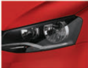
Vermelho Flash D8D8