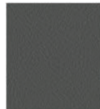
Couro Sintético Native CD (opcional)