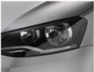
Prata Sirius 7Z7Z