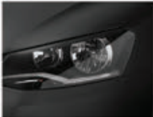
Preto Ninja A1A1