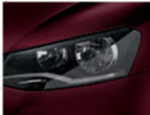
Vermelho Ópera S0S0