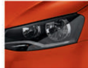
Laranja Canyon D4D4