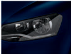
Azul Night Z2Z2