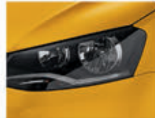
Amarelo Solaris 6U6U