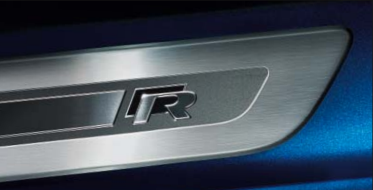
Abbildung zeigt teilweise Sonderausstattung gegen Mehrpreis.

Die hochwertigen Einstiegsleisten in Aluminium mit „R“-Logo setzen schon im Einstiegsbereich ein optisches Highlight, das die Vorfreude auf die Fahrt noch steigert. |s