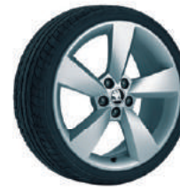
Jantes alliage 17" "Camelot" en option.