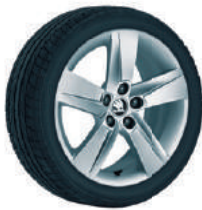
Jantes alliage 16" "Rock" en option.