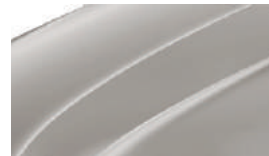
Beige Cappuccino (4K4K)