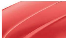
Rouge Corrida (8T8T)