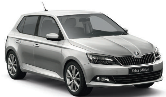
Gris Argent (8E8E)