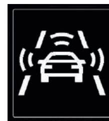
Front Assist (freinage automatique d'urgence).