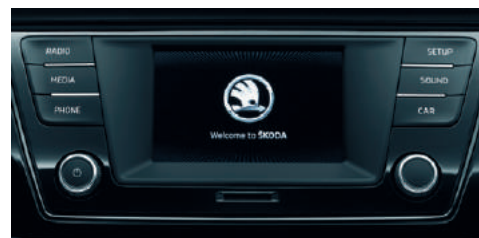
Radio "Swing" avec écran tactile, système téléphone mobile Bluetooth® et lecteur de carte SD.