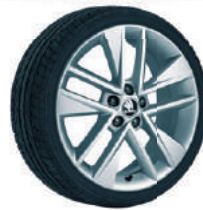
Jantes alliage 17" "Clubber" en option.