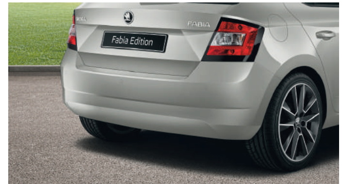
Véhicule équipé de l'option jantes alliage 17" "Savio" (disponible en accessoire).