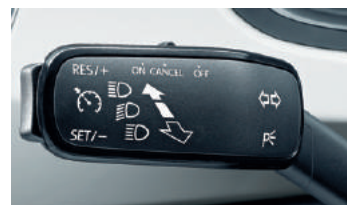
Régulateur + limiteur de vitesse.