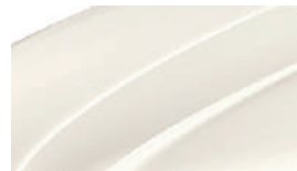
Blanc Cristal (9P9P)