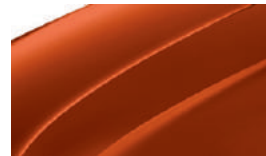
Rouge Rio (6X6X)