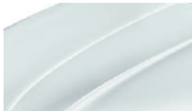
Blanc Lune (2Y2Y)