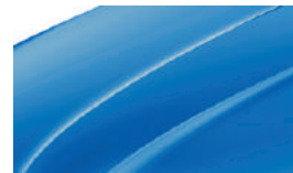
Bleu Racing (8X8X)