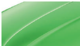
Vert Rallye (P7P7)