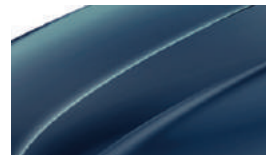
Bleu Pacifique (Z5Z5)