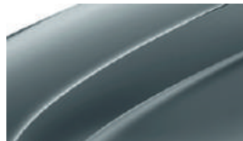
Gris Météore (F6F6)