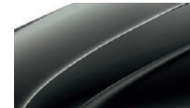
Noir Magic Nacré (I2I2)