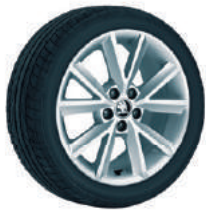
Jantes alliage 16" "Antia argent" de série.