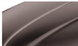
Marron Topaze (4L4L)