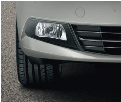
Phares avant antibrouillard.