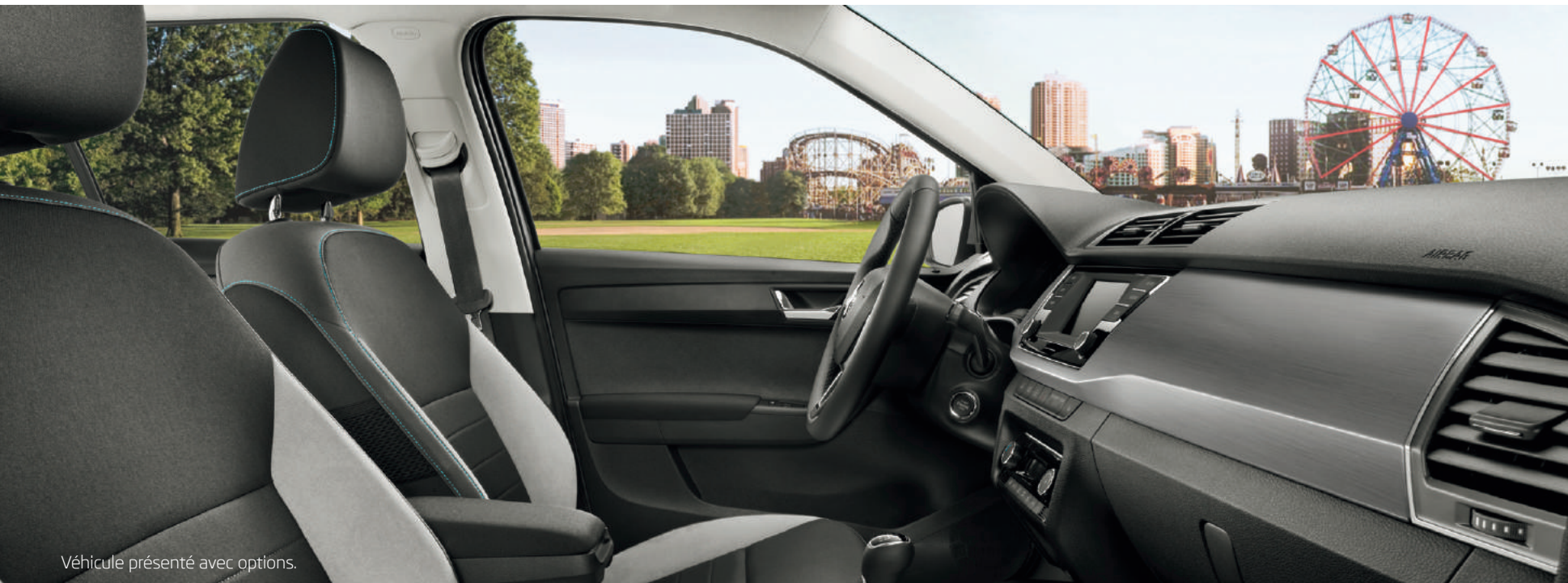
Véhicule présenté avec options.

L'habitacle de la Fabia Edition dispose d'une sellerie spécifique noire et d'un insert décoratif de tableau de bord type aluminium brossé. Le volant multifonctions, la climatisation mécanique, la radio "Swing" avec écran tactile et système téléphone mobile Bluetooth®, le régulateur/limiteur de vitesse et le Front Assist (freinage automatique d'urgence) viennent quant à eux assurer un maximum de confort et de sécurité.