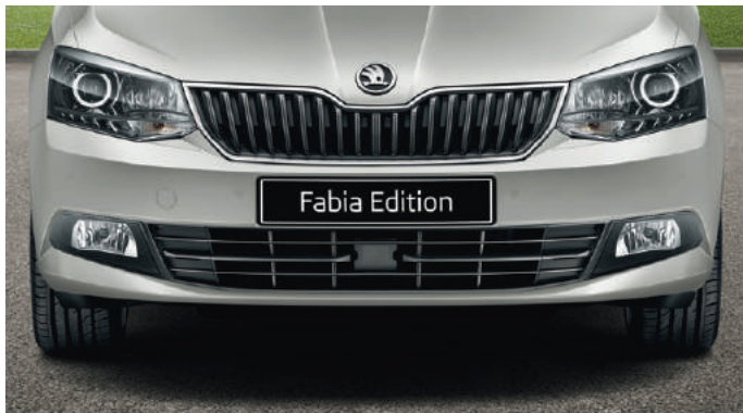
Phares avant avec projecteurs sur fond de couleur noire et feux de jour à LED.