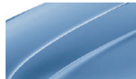
Bleu Denim (G0G0)