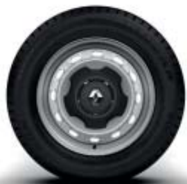
Enjoliveur 16'' mini