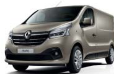
Beige Cendré** TE HNK