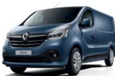
Bleu Panorama** TE J43