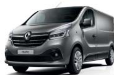
Gris Cassiopée** TE KNG