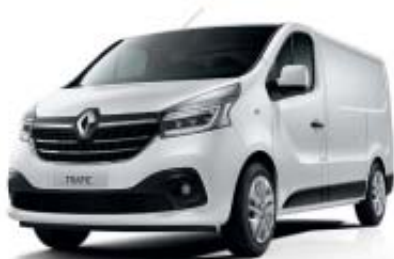
Blanc Glacier* OV 369