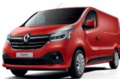
Rouge Magma** OV NNS / O C70 (1)