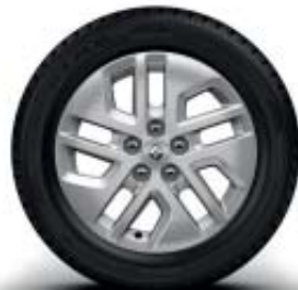
Jante aluminium 17''