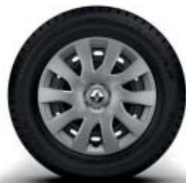
Enjoliveur 16'' maxi