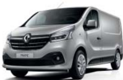
Gris Platine** TE D69