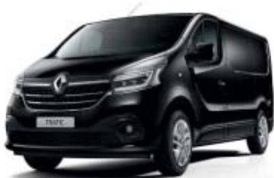
Noir Crépuscule** TE D68