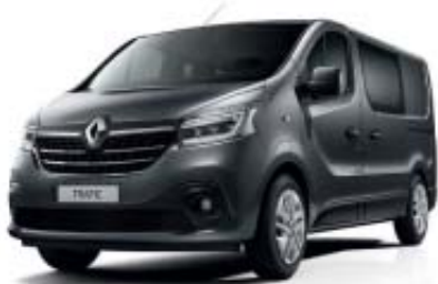
Gris Comète (2) TE KNA

* Opaque vernis, ** Peinture métallisée. (1) Sur H2 (2) Uniquement disponible en version Cabine Approfondie et Camping Car. Photos non contractuelles.