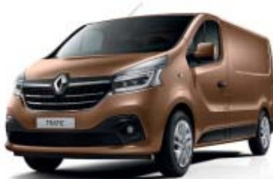
Brun Cuivre** TE CNH