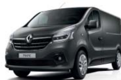
Gris Urbain* OV KPW