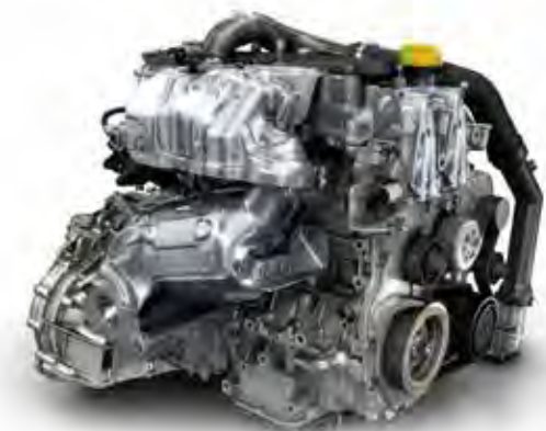
ENERGY TCe 115

*22% weniger Kraftstoffverbrauch und CO 2 -Emissionen beim ENERGY TCe 115 im Vergleich zum 1.6 16V 105.