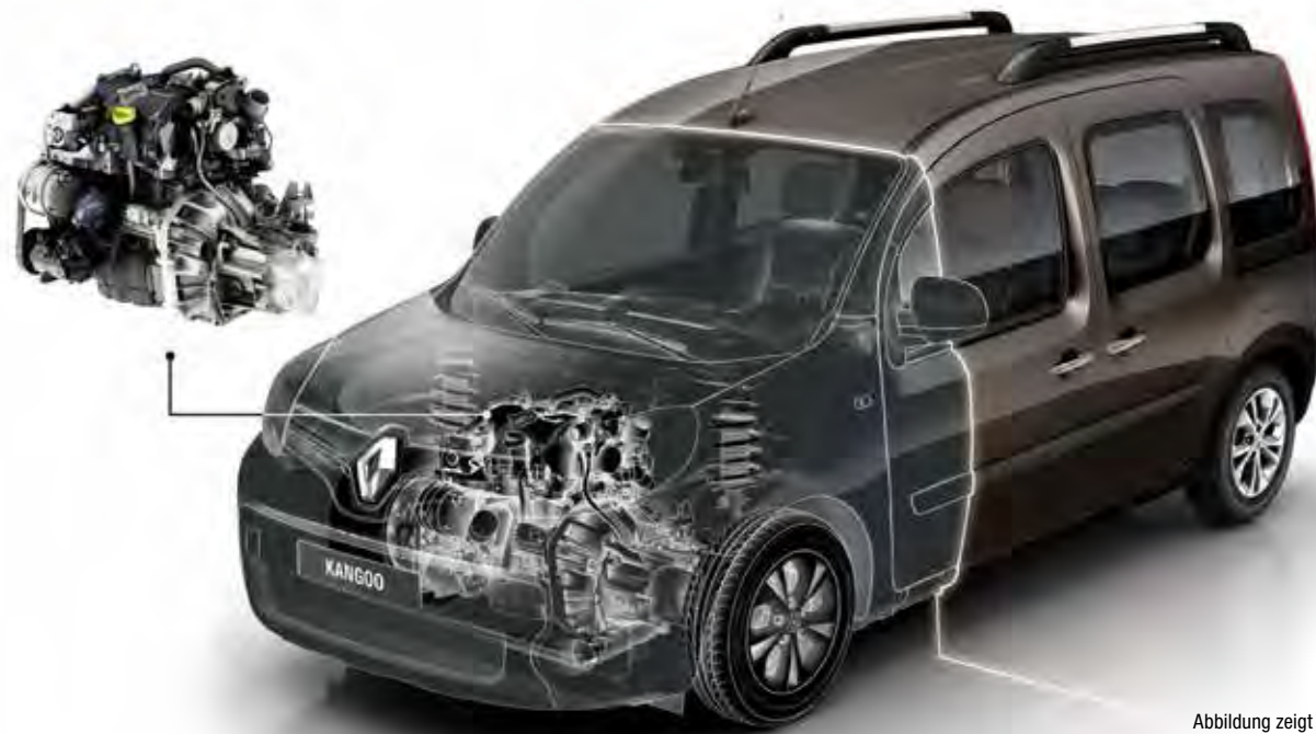
Abbildung zeigt ENERGY dCi 90.

IN DEN LEISTUNGSSTARKEN, SPARSAMEN RENAULT ENERGY DIESEL- UND BENZINMOTOREN SORGEN ZAHLREICHE MODERNE TECHNOLOGIEN DER MARKE RENAULT FÜR ÜBERZEUGEND NIEDRIGE VERBRAUCHS- UND CO 2 -EMISSIONSWERTE.