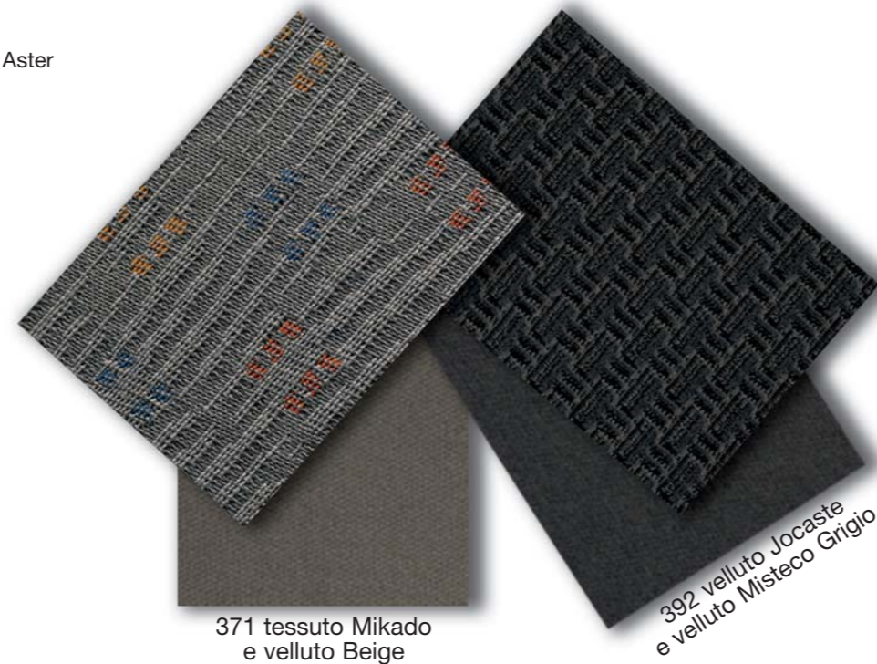
371 tessuto Mikado e velluto Beige

392 Velluto Jocaste e velluto Misteco Grigio