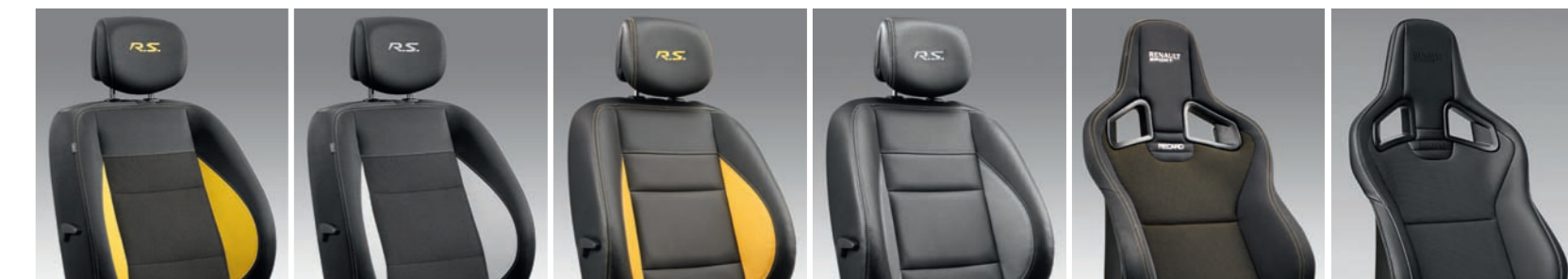
SIÈGES SPORT TISSU AMBIANCE JAUNE SIÈGES SPORT TISSU AMBIANCE GRISE SIÈGES SPORT CUIR* AMBIANCE JAUNE SIÈGES SPORT CUIR* AMBIANCE GRISE SIÈGES BAQUETS RECARO® TISSU AMBIANCE JAUNE SIÈGES BAQUETS RECARO® CUIR* AMBIANCE GRISE