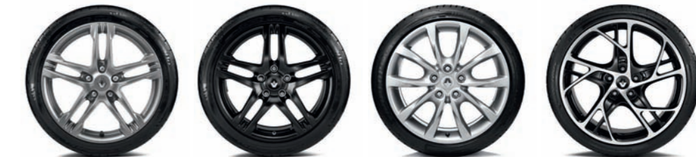
JANTE ALUMINIUM 18" AX-L CHROME SATINÉ JANTE ALUMINIUM 18" AX-L BLACK MAT JANTE ALUMINIUM 18" KEZA JANTE ALUMINIUM 19" STEEV