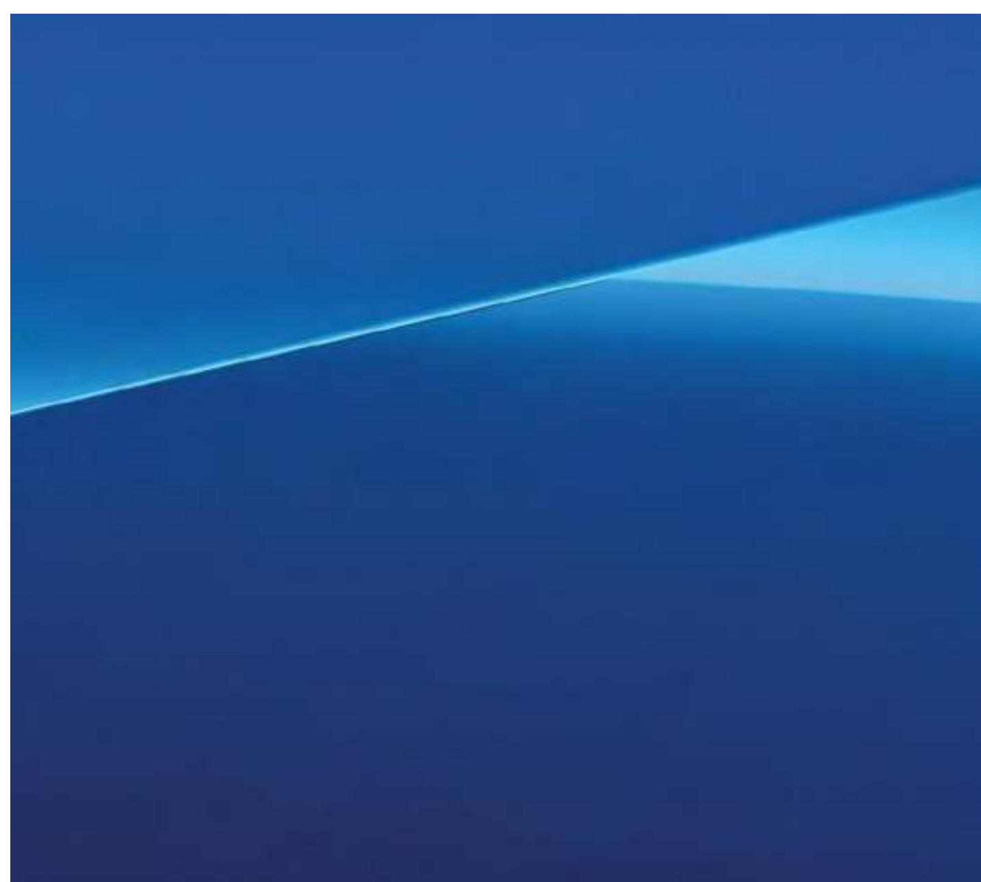
Bleu Alpine (option)