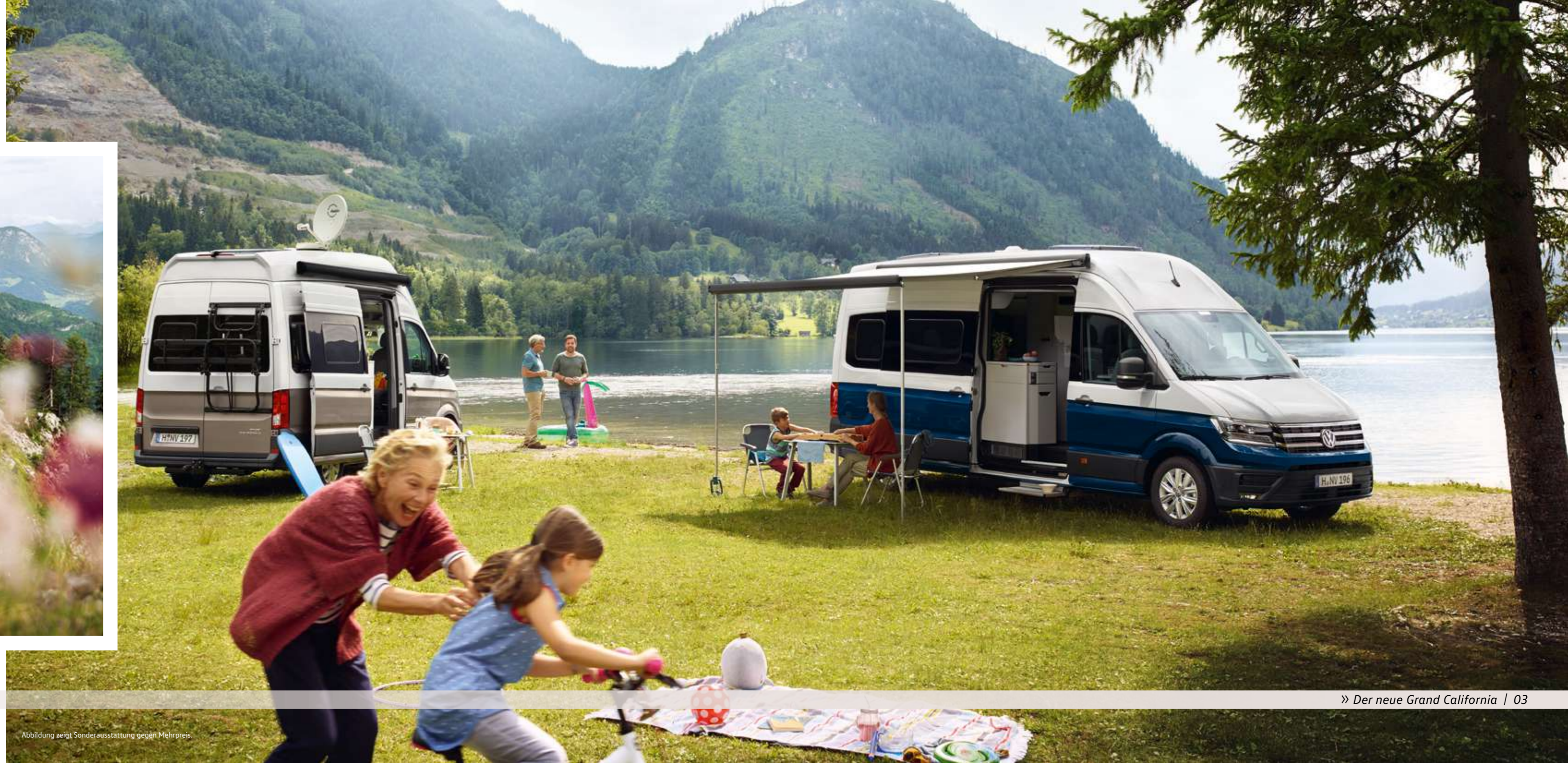
Abbildung zeigt Sonderausstattung gegen Mehrpreis.