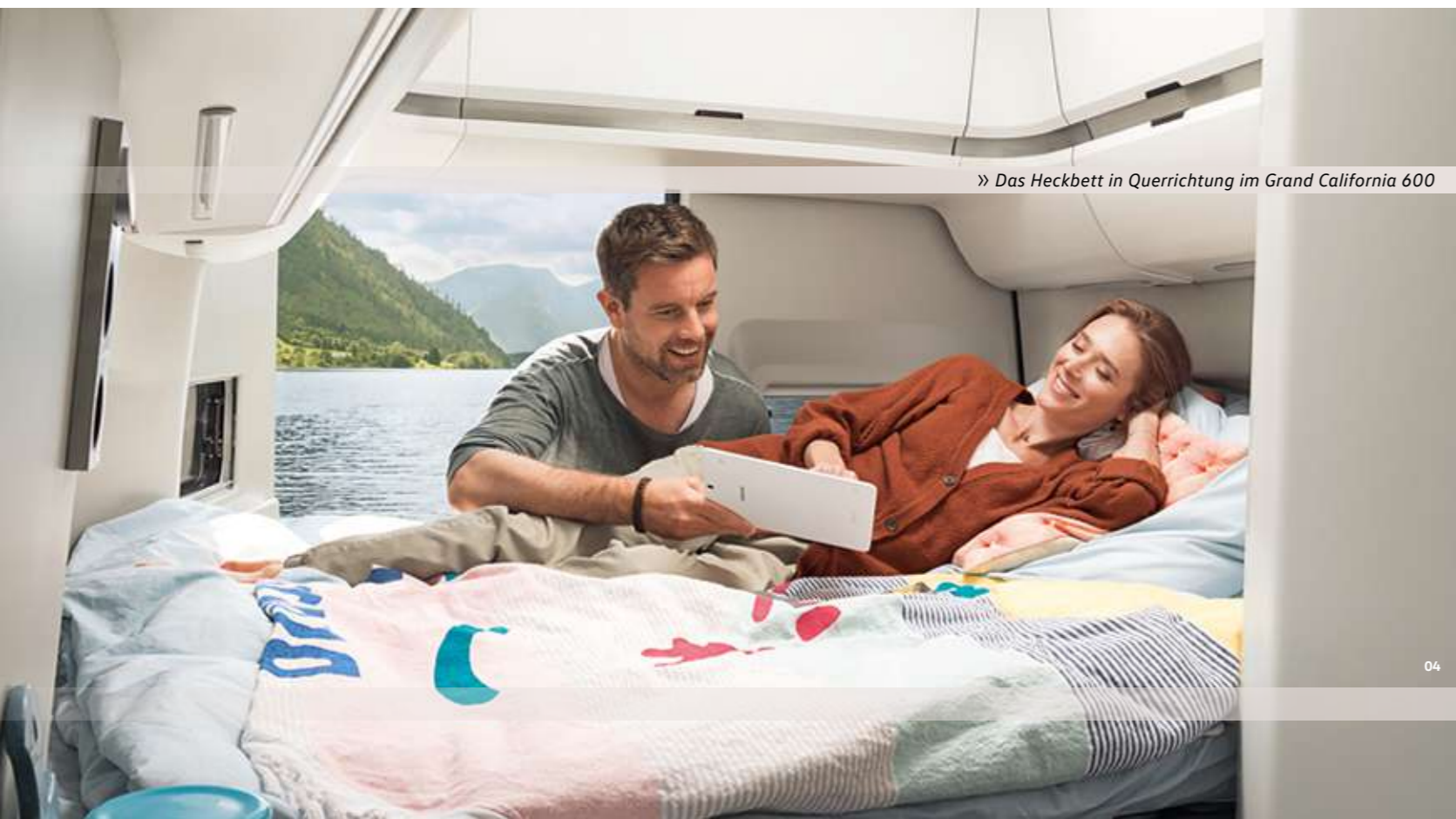
» Das Heckbett in Querrichtung im Grand California 600