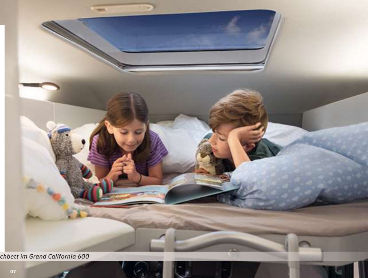
» Das optionale Hochbett im Grand California 600

07 Optionales Hochbett (1,60 m - 1,90 m x 1,22 m) mit Panoramadach (0,70 m x 0,85 m), Aluminiumleiter und Leseleuchte im Grand California 600. Es bietet 150 kg Traglast und Platz für zwei Kinder oder einen Erwachsenen. Der Lattenrost ist auf Knopfdruck heraus- ziehbar und das Panoramadach hat eine Verdun- kelung sowie ein Moskitonetz.