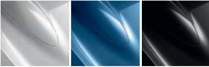
BLANC GLACIER (0V 369)